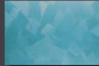
JUPOL Latex matt 570A DECOR Glamour GLAMOUR 7401