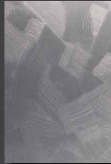
JUPOL Latex matt 030D DECOR Glamour GLAMOUR 7101