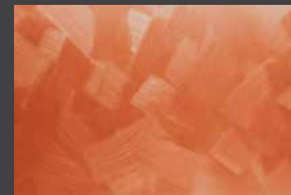
JUPOL Latex matt 390A DECOR Glamour GLAMOUR 7204