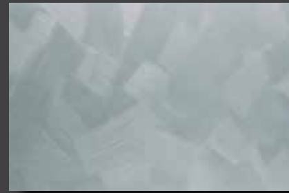
JUPOL Latex matt 570E DECOR Glamour GLAMOUR 7403