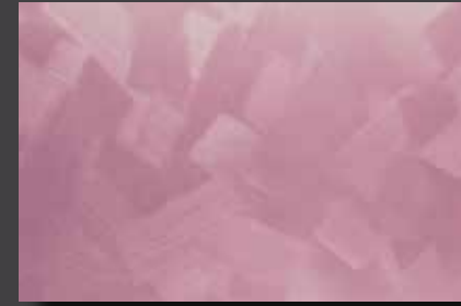
JUPOL Latex matt 430E DECOR Glamour GLAMOUR 7305