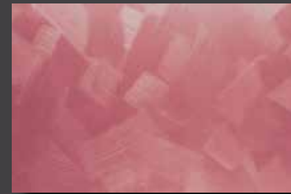
JUPOL Latex matt 400B DECOR Glamour GLAMOUR 7302