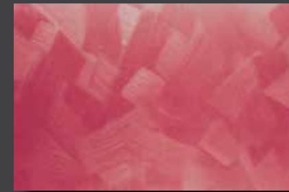
JUPOL Latex matt 420C DECOR Glamour GLAMOUR 7301