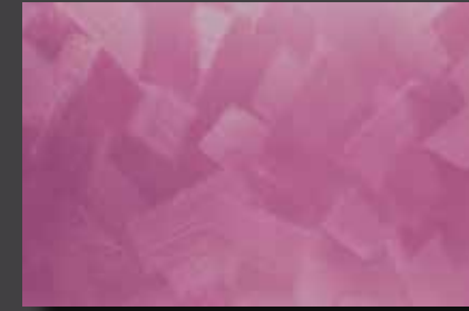
JUPOL Latex matt 460C DECOR Glamour GLAMOUR 7304