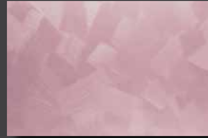
JUPOL Latex matt 460F DECOR Glamour GLAMOUR 7306