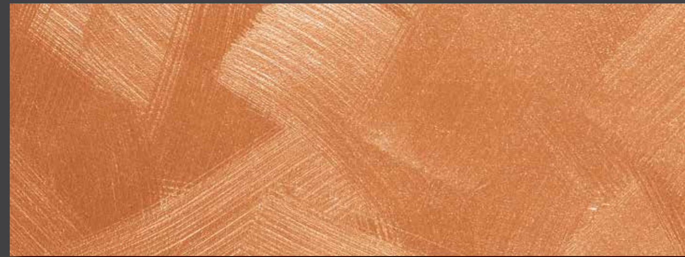
JUPOL Latex matt 380B DECOR Glamour GLAMOUR Bronze (7003)