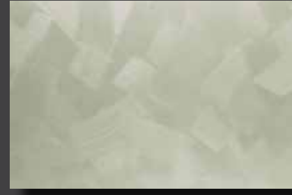
JUPOL Latex matt 180D DECOR Glamour GLAMOUR 7503