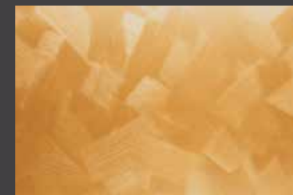
JUPOL Latex matt 300A DECOR Glamour GLAMOUR 7203