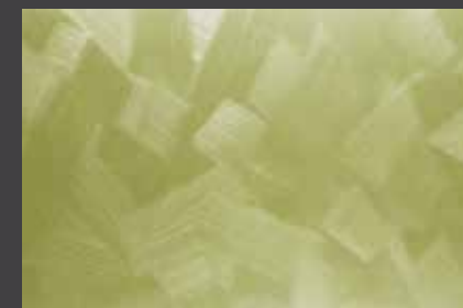
JUPOL Latex matt 200B DECOR Glamour GLAMOUR 7504