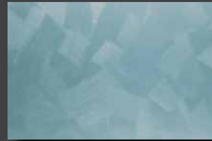
JUPOL Latex matt 570C DECOR Glamour GLAMOUR 7402