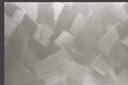
JUPOL Latex matt 050C DECOR Glamour GLAMOUR 7102