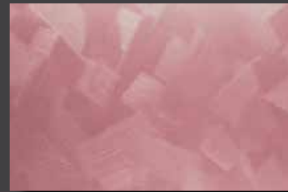
JUPOL Latex matt 100D DECOR Glamour GLAMOUR 7303