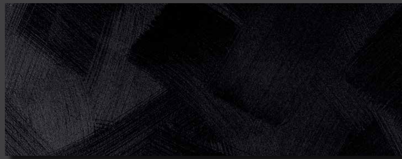
JUPOL Latex matt 010B DECOR Glamour GLAMOUR Black (7004)