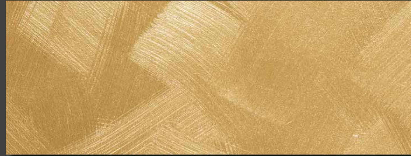
JUPOL Latex matt 300C DECOR Glamour GLAMOUR Gold (7001)