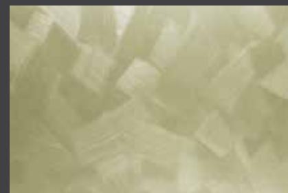
JUPOL Latex matt 200C DECOR Glamour GLAMOUR 7505