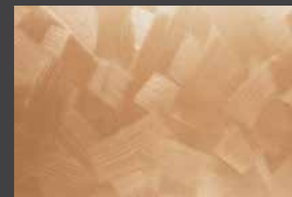
JUPOL Latex matt 320C DECOR Glamour GLAMOUR 7202