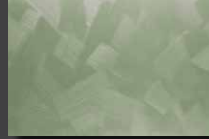
JUPOL Latex matt 190E DECOR Glamour GLAMOUR 7502