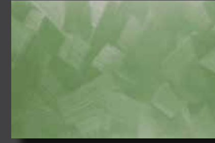
JUPOL Latex matt 190C DECOR Glamour GLAMOUR 7501