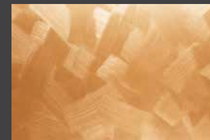
JUPOL Latex matt 120C DECOR Glamour GLAMOUR 7201