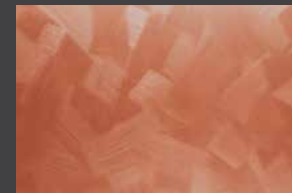
JUPOL Latex matt 390A DECOR Glamour GLAMOUR 7205